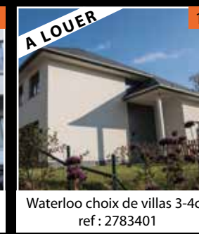
Waterloo choix de villas 3-4ch ref : 2783401