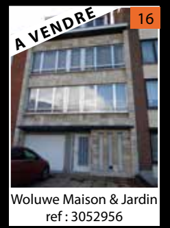
Woluwe Maison & Jardin ref : 3052956