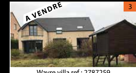
Wavre villa ref : 2787259