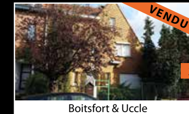
Boitsfort & Uccle