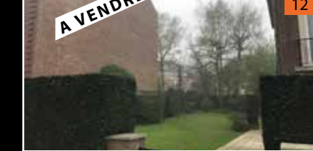
Ixelles Roosevelt TERRAIN ref : 3065894