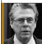
Par Paul Grosjean