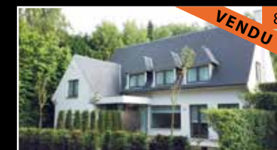
Rhode St Genese