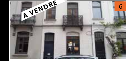
Ixelles Maison - Chatelain ref : 2921339