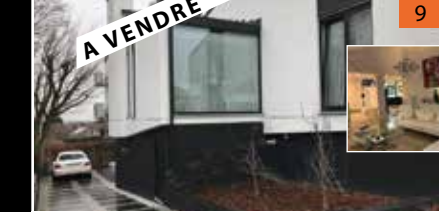
Meise Villa 4f total renovée ref : 30129 03