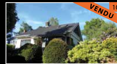
Woluwe Saint pierre