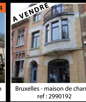
Bruxelles - maison de charme ref : 2990192