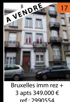
Bruxelles imm rez + 3 apts 349.000 € ref : 2990554

Estimation gratuite 7 jours/7 – en 24 heures !