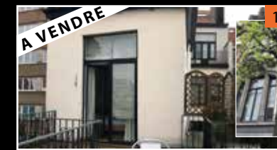
Etterbeek EU district 3 apts 2 & 3 ch