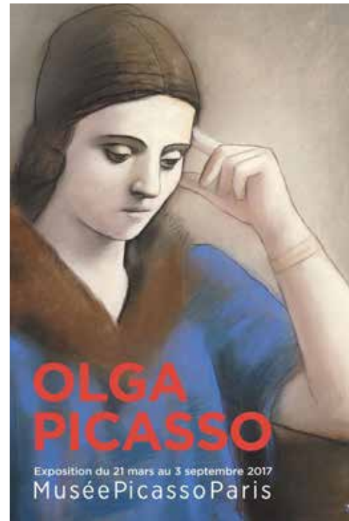
1. Eeckman soutient Art on paper chaque année. 2. L'exposition Olga Picasso s'est tenue au Musée Picasso à Paris.