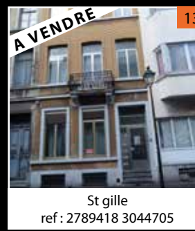
St gille ref : 2789418 3044705